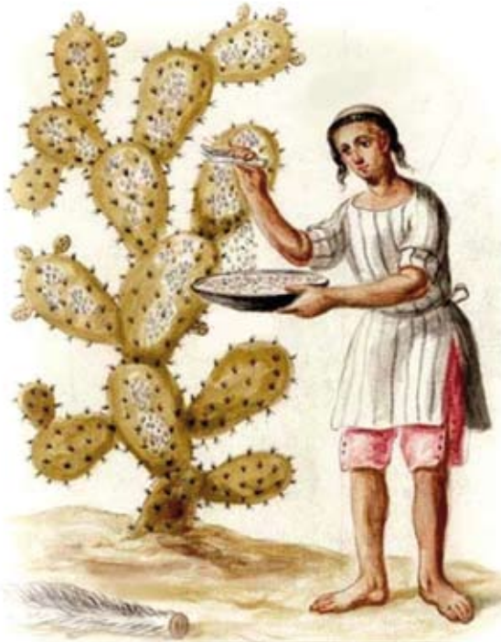
Indígena que recoge la cochinilla con una Colita de Venado

La grana cochinilla podría apoyar la economía regional