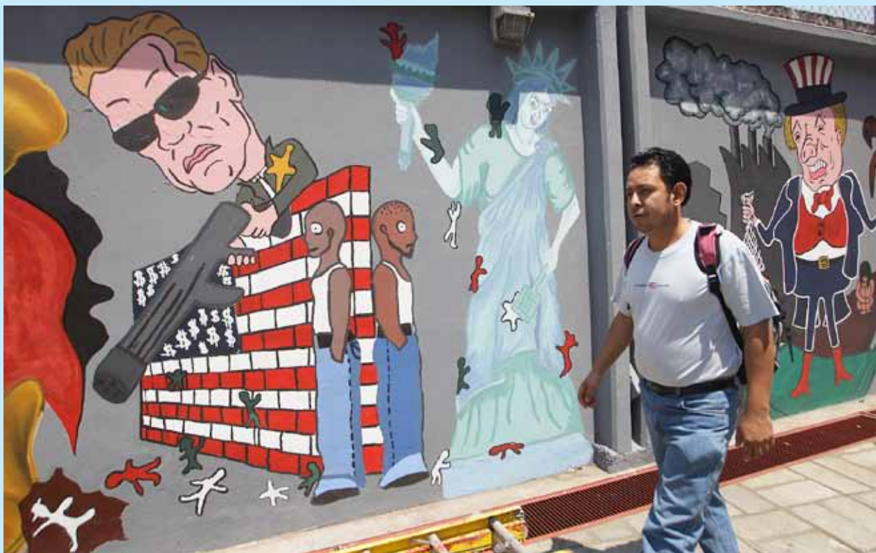
Detalle de mural en el plantel Carmen Serdán, Miguel Hidalgo.