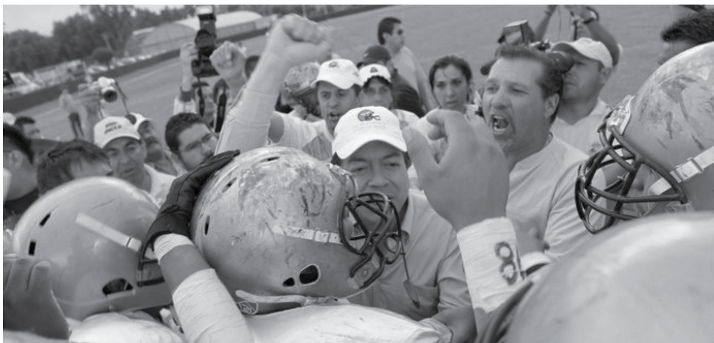
El Secretario de Educación del DF, Mario Delgado Carrillo motivando a los integrantes del equipo.

Delgado Carrillo ha sido un entusiasta promotor del deporte, y animó en todo momento al equipo capitalino: "Ustedes son un ejemplo, son líderes de su prepa, de su familia, de su comunidad, de su ciudad. Para nosotros, ustedes son campeones, y acostúmbrense a jugar finales, que ésta no va a ser la última", les dijo al terminar el partido.